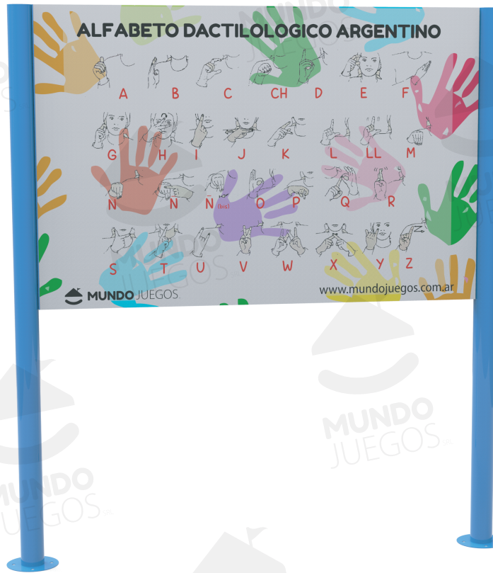
Imagen referencial. Para más información ingrese a www.mundojuegos.com.ar